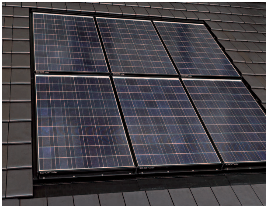
SCHOTT INDAX® 214/225/230/235